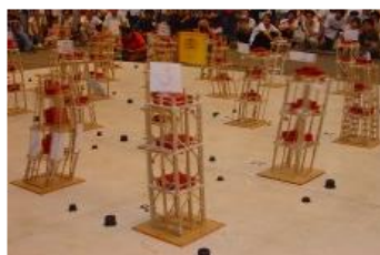
图 1 加载示意图

所有参赛队伍的模型自身质量( M_M )、承载铁块的加重量( W_e )，与测试后之模型能承受的最大地震力大小( I ) (详见模型破坏准则)，都将被记录下来，用以计算每个参与队伍模型的效率比(efficiency ratio，具体计算方法见赛题第四、五部分)。