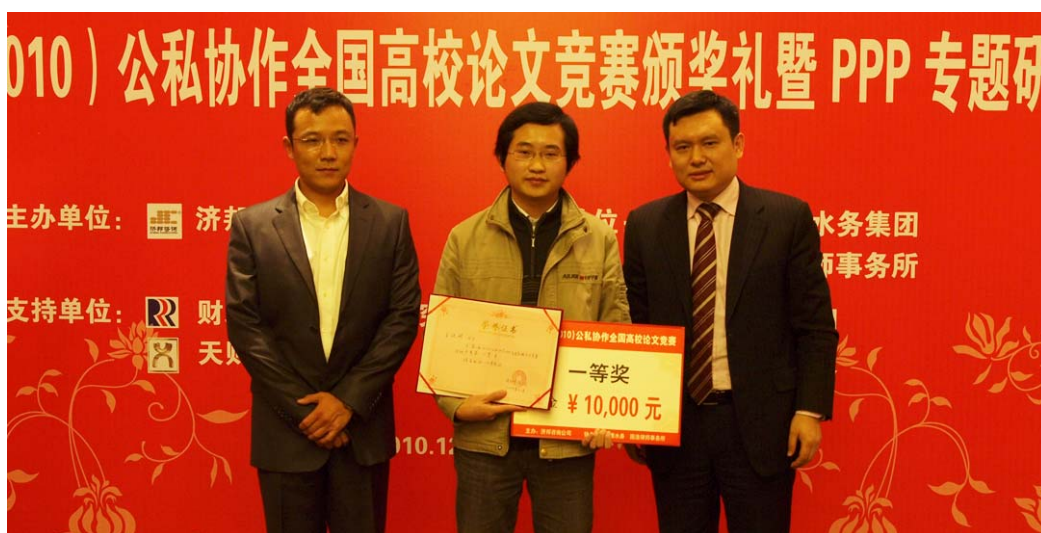
一等奖获得者与颁奖嘉宾