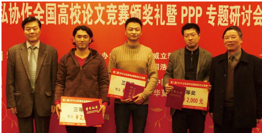
三等奖获得者与颁奖嘉宾