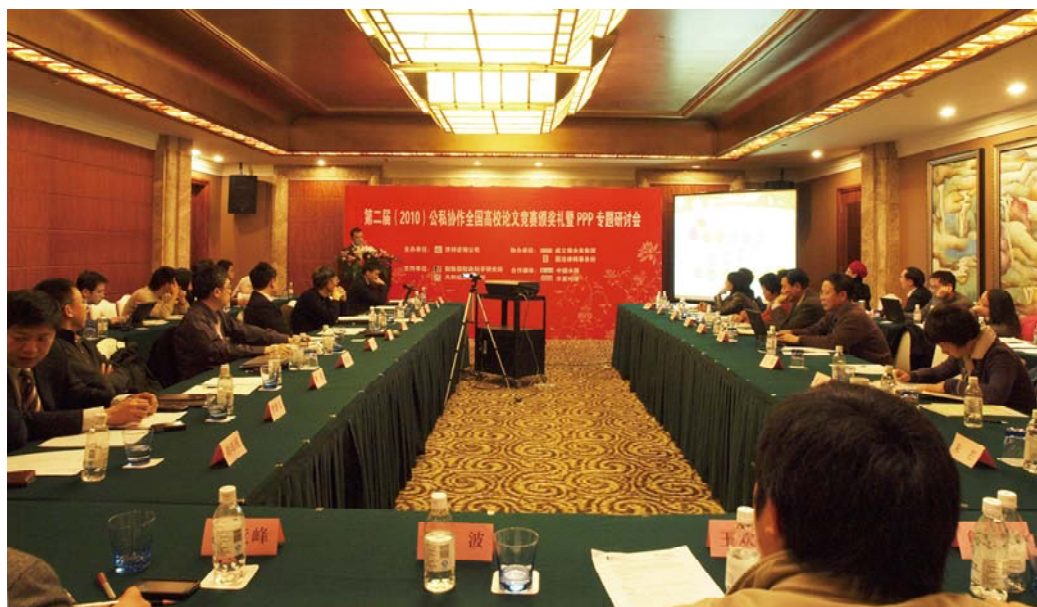
第二届PPP论文竞赛颁奖礼暨PPP专题研讨会现场