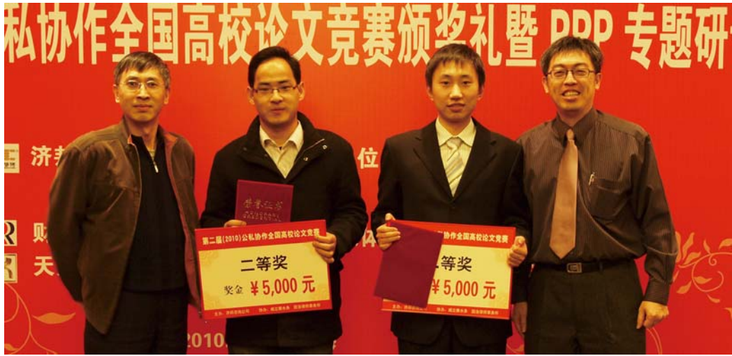
二等奖获得者与颁奖嘉宾