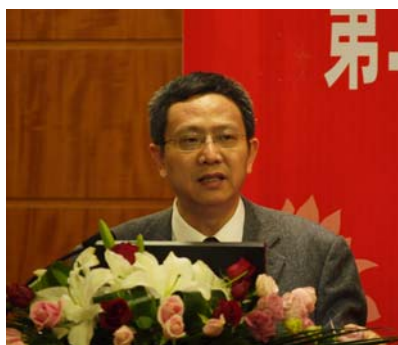
财政部财政科学研究所所长贾康