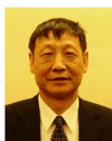
曹远征 中银国际控股有限公司 董事兼首席经济学家

正是有了以上各位的倾力相助，第一届论文竞赛以“宣传PPP理念，推动相关问题的研究”为要义的活动主旨得以实现。从收到的论文来看，许多参赛同学对PPP应用所进行的深入思考及独特见解，都超过了我们最初的预料。以下是第一届论文竞赛的盛况采摘：