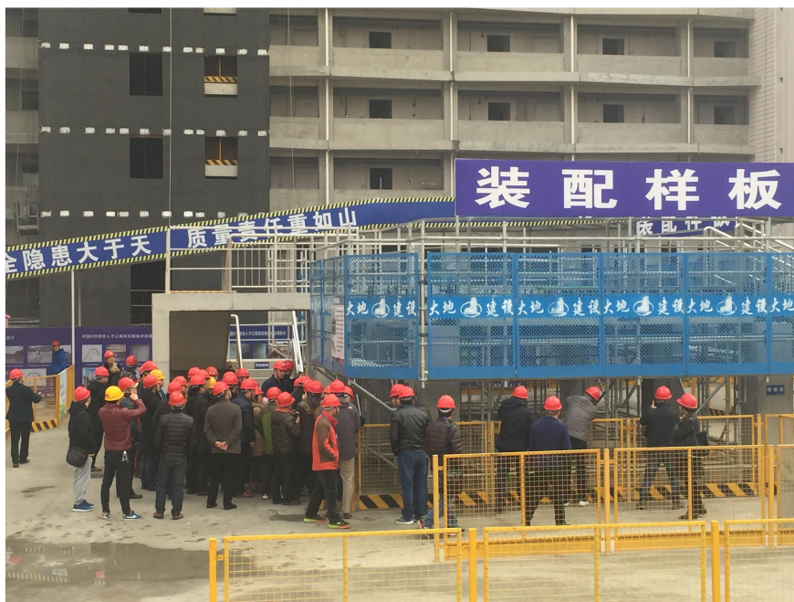
学员们在现场参观实习

老师讲得好，学员听得认真，本次培训班得到了所有参与人员的一致好评。后期，我院还将与继续教育学院、南京房地产教育培训中心陆续开展装配式建筑和 BIM 技术等项目的专项培训。